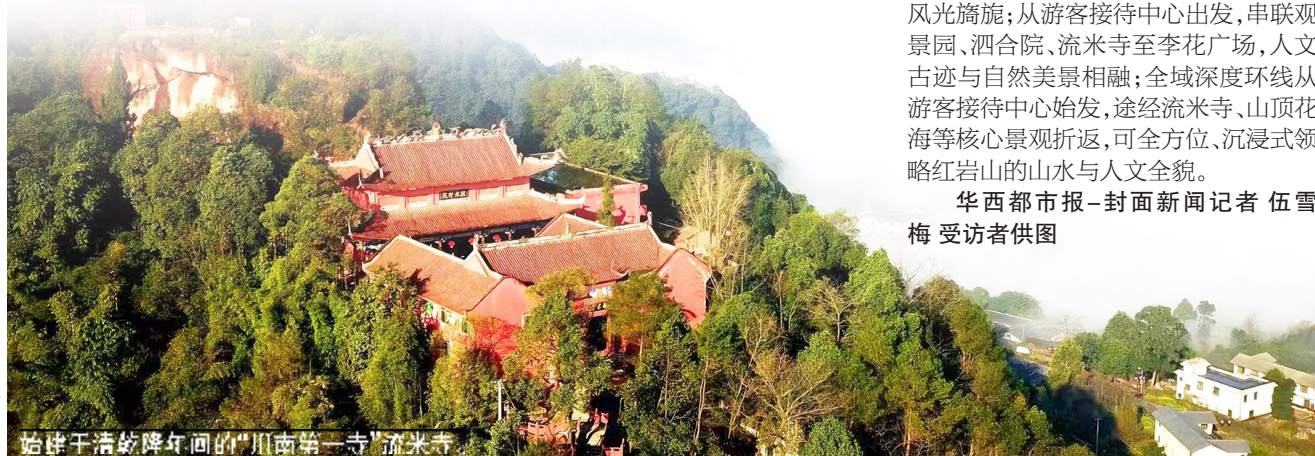
始建于清乾隆年间的“川南第一寺”流米寺。

除了上述动植物的发现，达州还出现了猕猴、中华斑羚、豹猫、红腹角雉、红腹锦鸡等国家二级重点保护动物和扇脉杓兰、绿花杓兰等国家二级重点保护濒危野生植物的身影。这些珍稀野生动植物频繁出现在达州，构成了达州生物多样性的生动图谱。