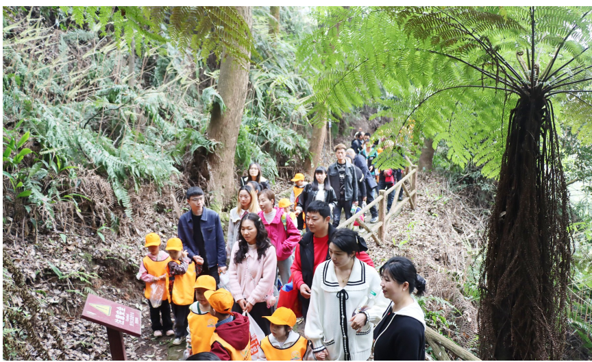
亲子团在桫欏海徒步。