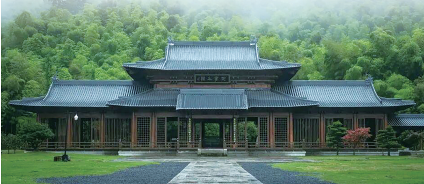
浙江绍兴兰亭天章寺。图据浙江文旅政务微信公众号

而这背后真正决定性的能力，就是审美治理能力。将地方故事、感知系统与现代逻辑融合，服务于一个统一而独特的叙事体系，让景区的元素不再割裂，令游客拥有“只有这里才有”的深度沉浸感。