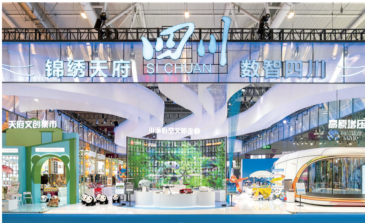
四川展馆总面积980平方米，汇聚了70余家本土文化企业、园区及基地。

◆ 5月21日，为期5天的第二十二届中国（深圳）国际文化产业博览交易会在深圳国际会展中心拉开帷幕。四川展馆以“锦绣天府·数智四川”为主题，全方位呈现巴蜀文化与前沿科技深度融合的最新硕果，迅速成为展会现场的人气焦点。