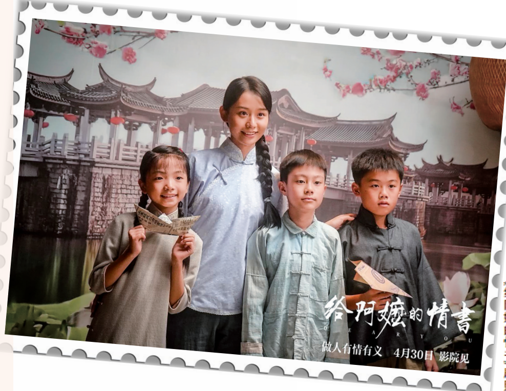
《给阿嬷的情书》剧照