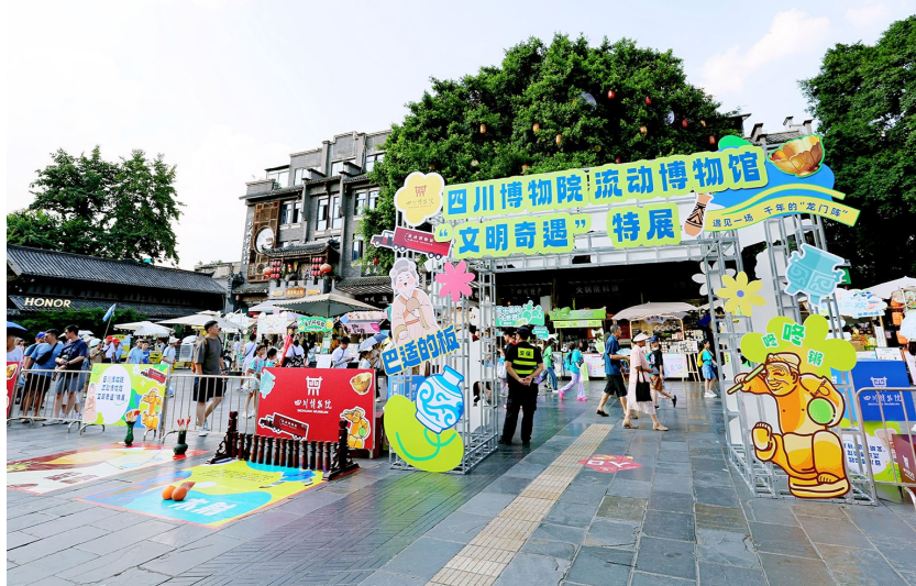
2025年四川博物院流动博物馆“文明奇遇”城市巡展。

同时，不少原本需要购买门票的博物馆，都推出免费参观服务。其中，成都杜甫草堂博物馆、成都武侯祠博物馆、成都永陵博物馆、成都自然博物馆（成都理工大学博物馆）按照免费不免票的原则，对公众实行预约免费开放。观众朋友可提前在各博物馆官方