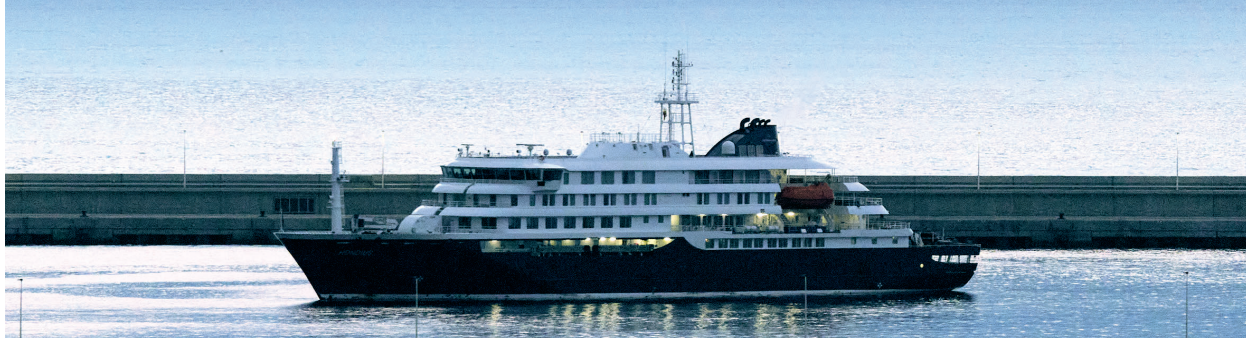
这是5月10日在西班牙特内里费岛格拉纳利亚港拍摄的“洪迪厄斯”号邮轮。

当地时间5月10日凌晨,记者在现场看到,涉汉坦病毒疫情邮轮“洪迪厄斯”号已在西班牙特内里费岛格拉纳利亚港水域抛锚停泊。