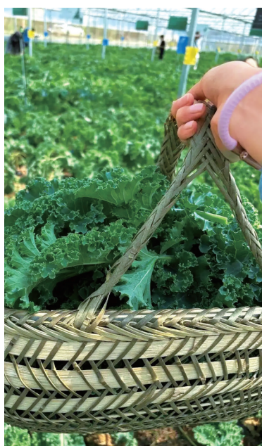
云南石屏的羽衣甘蓝迎来收获季。