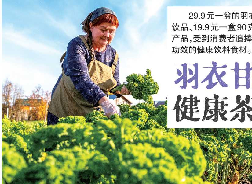
在内蒙古呼伦贝尔市额尔古纳市恩和俄罗斯族民族乡,当地农户在菜园里采摘羽衣甘蓝。

29.9元一盆的羽衣甘蓝盆栽、7.9元100克的有机羽衣甘蓝、19元500毫升的羽衣纤体瓶果蔬饮品、19.9元一盒90克的羽衣甘蓝粉……曾经绿化带里的常见植物羽衣甘蓝,如今被制作成各类产品,受到消费者追捧。尤其在茶饮界,它被商家包装成一种既满足“奶茶瘾”,又兼具“瘦身排毒”功效的健康饮料食材。事实果真如此吗?