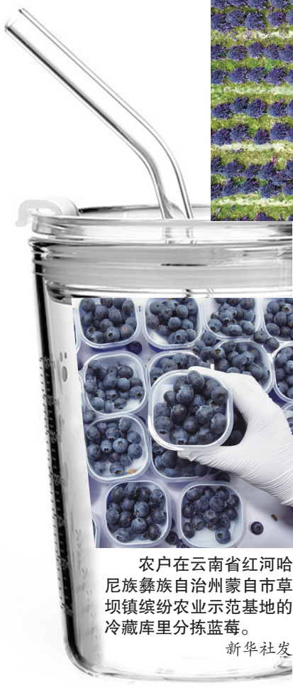
农户在云南省红河哈尼族彝族自治州蒙自市草坝镇缤纷农业示范基地的冷藏库里分拣蓝莓。

浙江省人民医院临床营养科主任医师叶飒介绍,羽衣甘蓝每100克可食用部分约含4.1克膳食纤维,在蔬菜中属于较高水平;此外,羽衣甘蓝热量低,每100克仅约50千卡,适合减肥减脂人群。