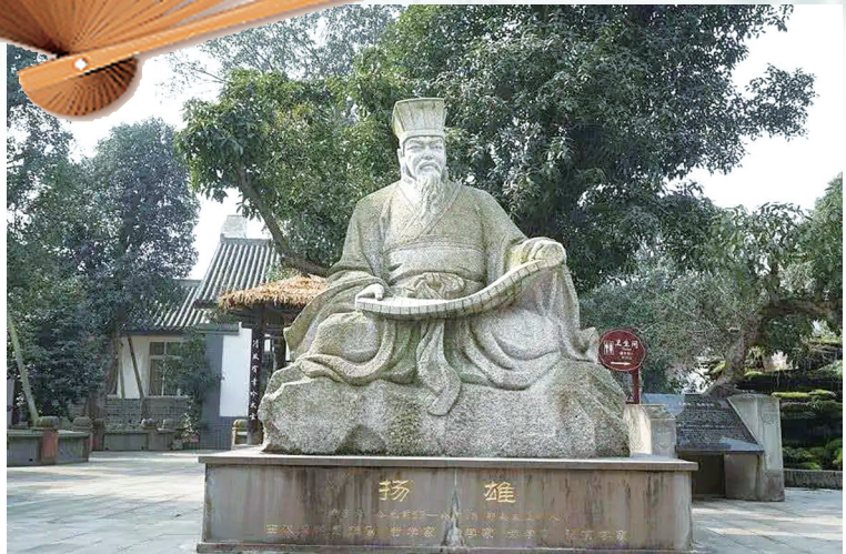
坐落于成都市郫都区的扬雄雕塑。