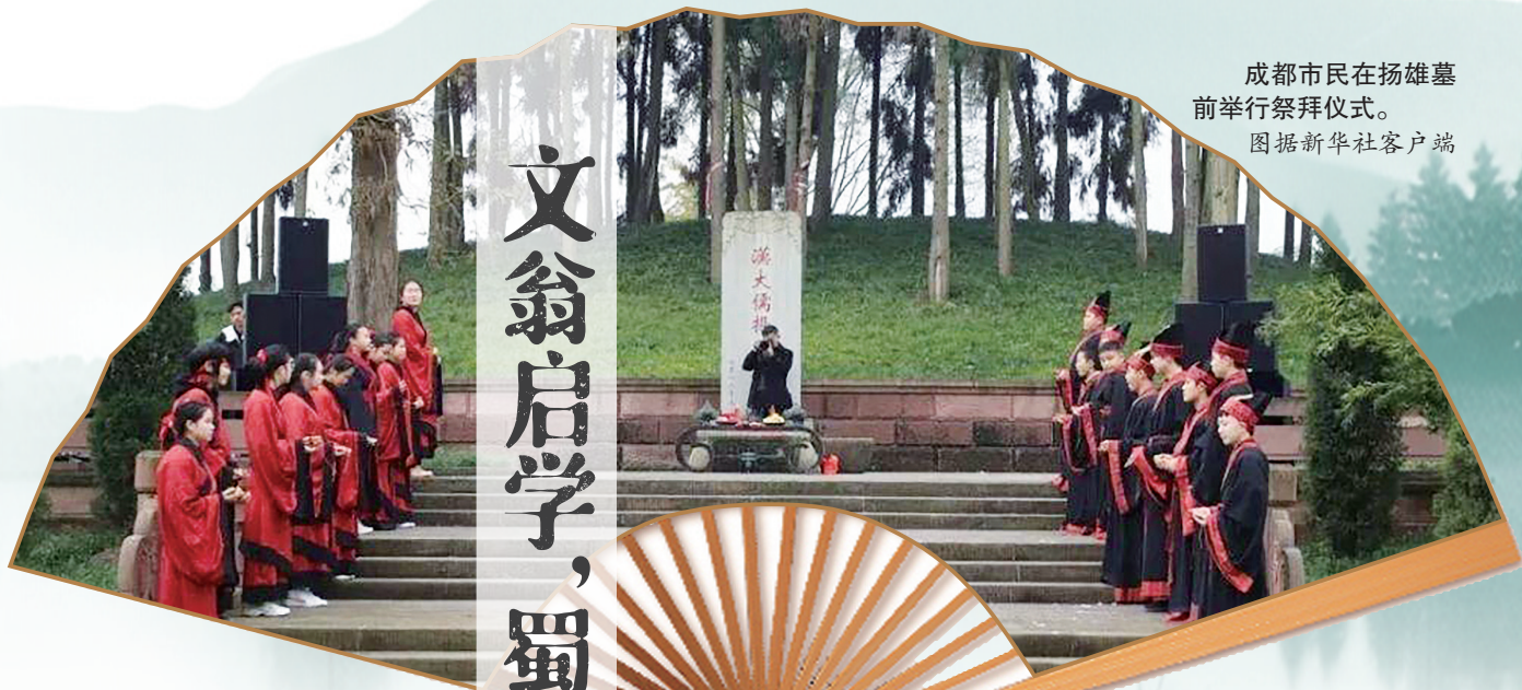
成都市民在扬雄墓前举行祭拜仪式。