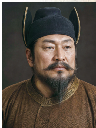
复旦大学科技考古团队根据李克用颅骨和基因数据制作了李克用的肖像复原示意图。