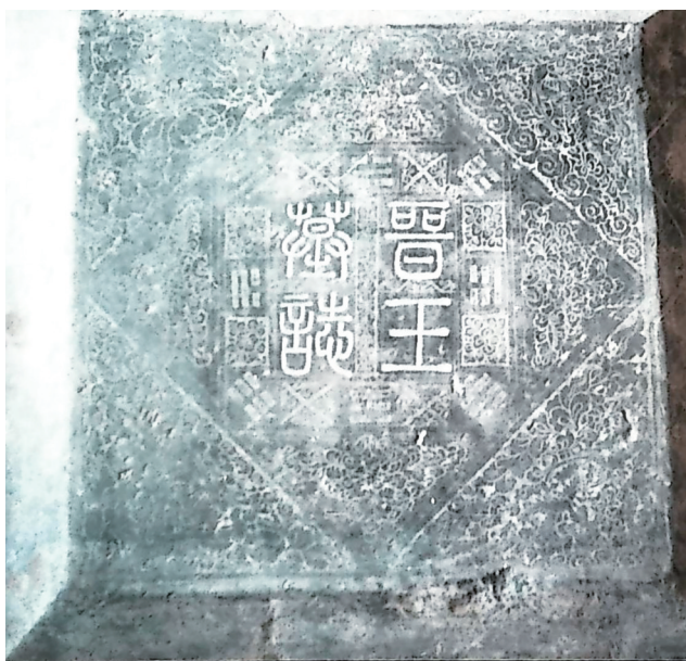
李克用墓出土的“晋王墓志”。