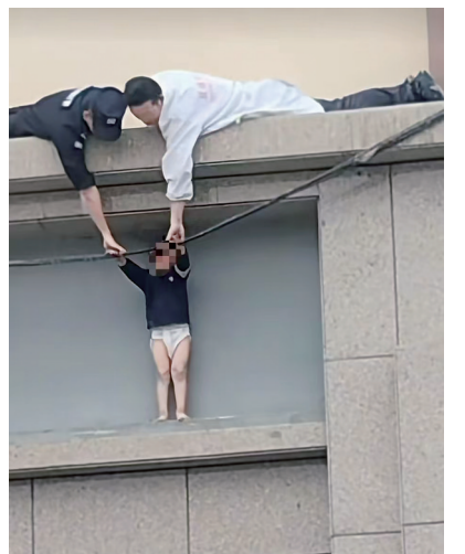
施救现场。视频截图