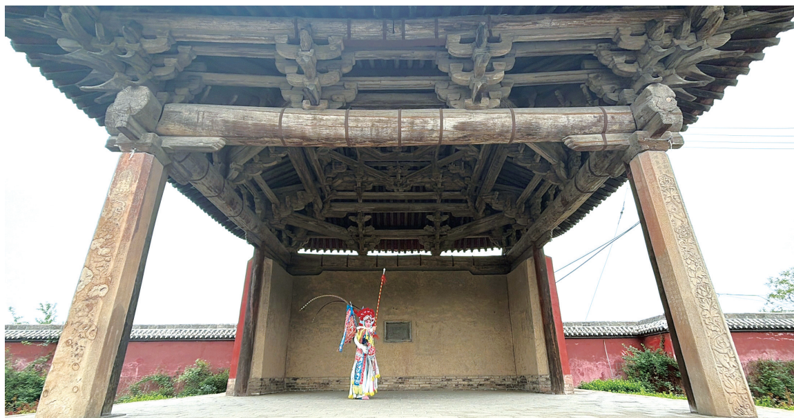
中国戏剧梅花奖获得者梁静在山西临汾尧都区牛王庙戏台上表演蒲剧。

4月21日，“何以中国·屋檐上的文脉”网络传播活动继续在山西临汾这方热土上开启古戏台探访之旅。临汾，古称平阳，历史悠久，既是华夏文明的发祥地，也是戏曲艺术的摇篮。当天，记者探访了位于临汾市尧都区的两座元代古戏台，感受戏曲艺术在这片土地上的生生不息。