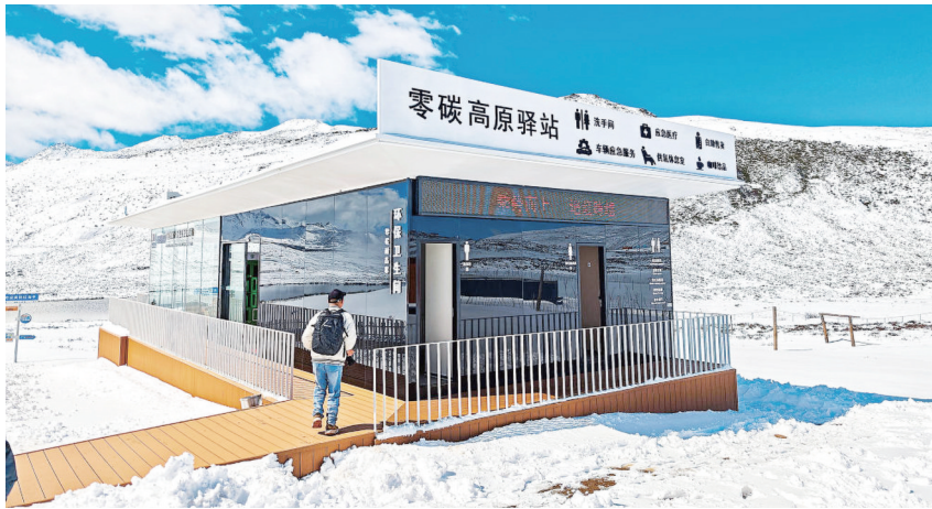
甘孜红海子景区的“飞机厕”，依托真空负压技术，不需要大量水冲，靠真空负压能瞬间把排泄物和异味“吸走”。