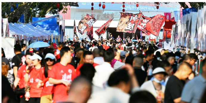
4月25日，川超决赛阶段第七轮打响，图为德阳体育场外的德阳好物市集。

体育竞技的热血之外，在地文化、特色风物、市井烟火全面入局，形成动静相融的独特氛围。