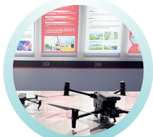
成都东服务区内的低空经济服务中心。