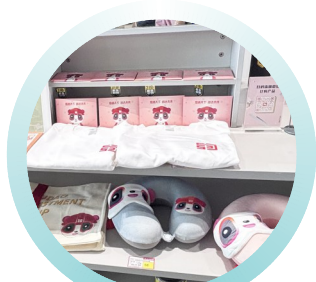
成都东服务区的文创产品。