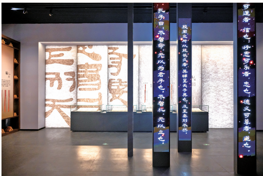
江西南昌汉代海昏侯国遗址博物馆展厅内部。