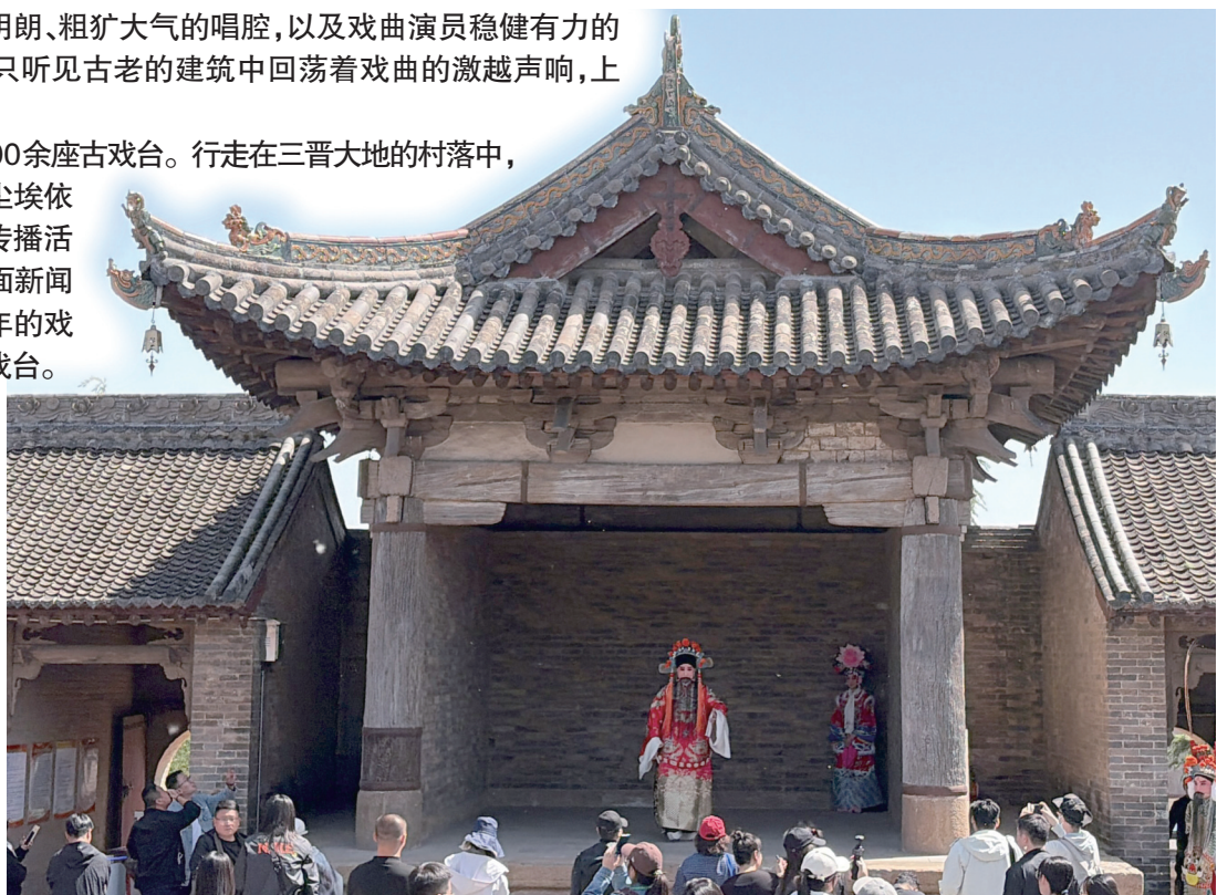
高平市王报村二郎庙戏台上，戏曲演员正在演出。