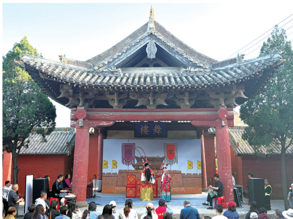
沁水县郭壁村府君庙的元代戏台正在上演《三关排宴》。

山西是中华戏曲的摇篮，这片土地上星罗棋布着3000余座古戏台。行走在三晋大地的村落中，能看到来自不同历史时期的古戏台，它们穿越历史的尘埃依旧矗立。4月17日，“何以中国·屋檐上的文脉”网络传播活动在山西晋城高平市启动。当天下午，华西都市报、封面新闻记者走进高平王报村，看到了国内现存最早有明确纪年的戏台，更在沁水县郭壁村中，目睹一座玲珑别致的元代古戏台。