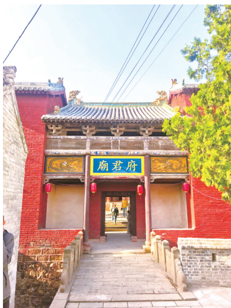
沁水县郭壁村府君庙。