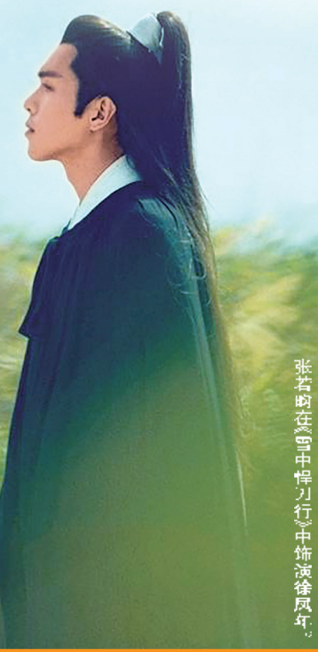
张若昀在《长津湖》中饰演徐凤年。