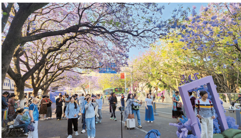
4月16日早上,西昌航天北路的梯子和摊位已被拆除。