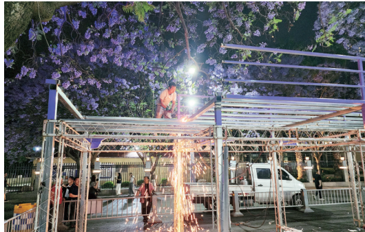
4月15日晚,工作人员连夜拆除钢架平台。