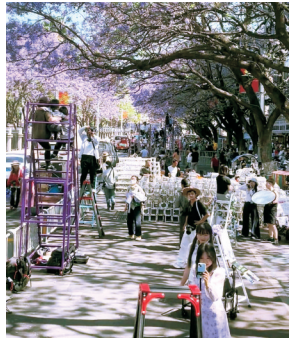
赏花点被一排排梯子占据。 网友发布的视频截图

当天晚上,西昌市文广旅局联合城管、公安、应急、市场监管等部门,连夜开展集中整治,拆除私自搭建的拍摄设施,取缔了不规范收费行为。