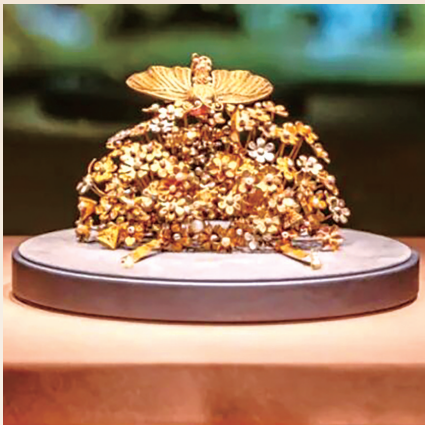
闹蛾金钗