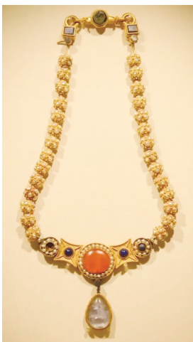
隋嵌珍珠宝石金项链。

此金项链从制作工艺和装饰形制来看，融合了波斯与中亚风格，“多面金珠”源自古希腊迈锡尼文明，青金石产自中亚阿富汗地区，凹雕花角鹿来自粟特文化，每个细节都呈现了丝绸之路上文明的交融。