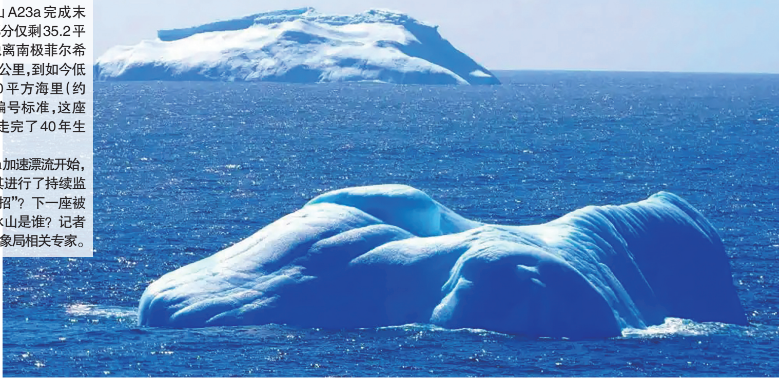
在南极威德尔海拍摄的冰山。

从2022年末A23a加速漂流开始,我国风云气象卫星对其进行了持续监测。监测用了哪些“绝招”?下一座被持续监测的“巨无霸”冰山是谁?记者4月12日采访了中国气象局相关专家。