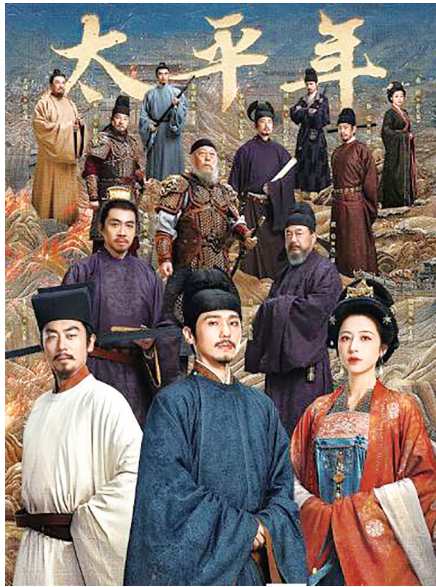
《太平年》海报。