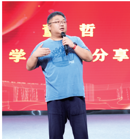
董哲和南充电影工业职业学院学子交流。