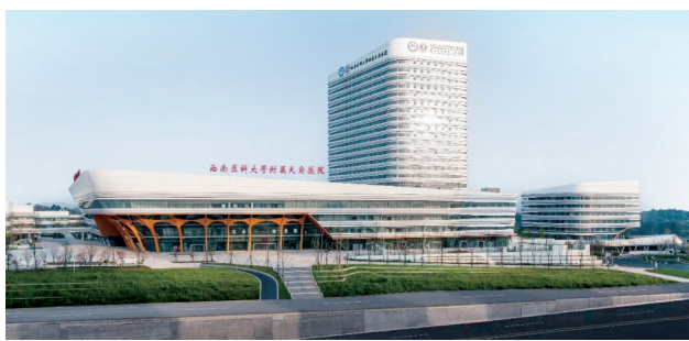
西南医科大学附属天府医院效果图。

国际欧亚科学院院士、中国区域科学协会副理事长方创琳认为,成都都市圈还要进一步推进深度同城化,实现从物理空间的临近向综合功能的提升、从量的集聚向质的提升,建成一个休戚与共的“朋友圈”。随着重大项目的加速落地,一个更高级别的成都都市圈正稳步走来。