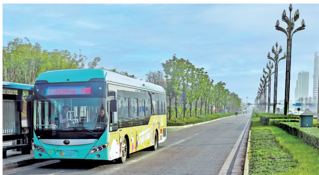
成眉跨市公交网络不断扩展。图据眉山天府新区微信公众号