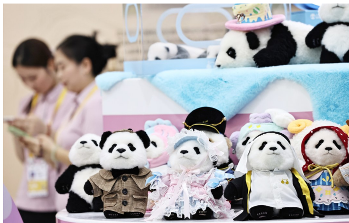
4月13日在第六届消博会四川展台拍摄的熊猫玩偶。

本届消博会主会场设置八大展馆、七大特色展区,全面覆盖科技、时尚、健康、国潮等核心消费赛道,为全球精品搭建起展示交流的重要平台。国际参展部分,主宾国加拿大搭建了400平方米的国家馆,集中展示其特色产品与文化;瑞士、捷克、爱尔兰等12个国家和地区组织官方团参展,俄罗斯、保加利亚等国首次设立国家馆,进一步丰富了国际展品的多样性。