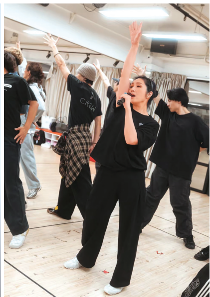
为成都站紧张排练的杨千嬅。