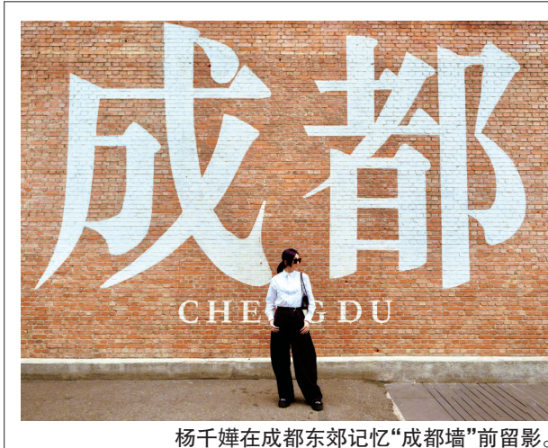
杨千嬅在成都东郊记忆“成都墙”前留影。