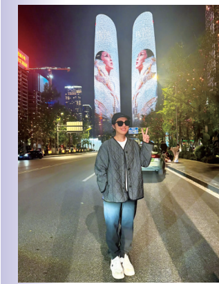
在成都双子塔和“自己”打卡。