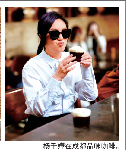
杨千嬅在成都品味咖啡。