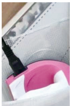
拼豆玩家使用的熨斗并无3C认证标识。