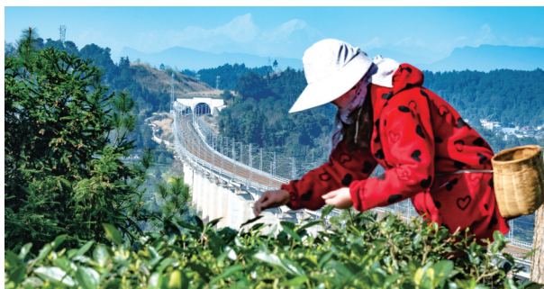
采茶人和不远处的铁道线同框入画。