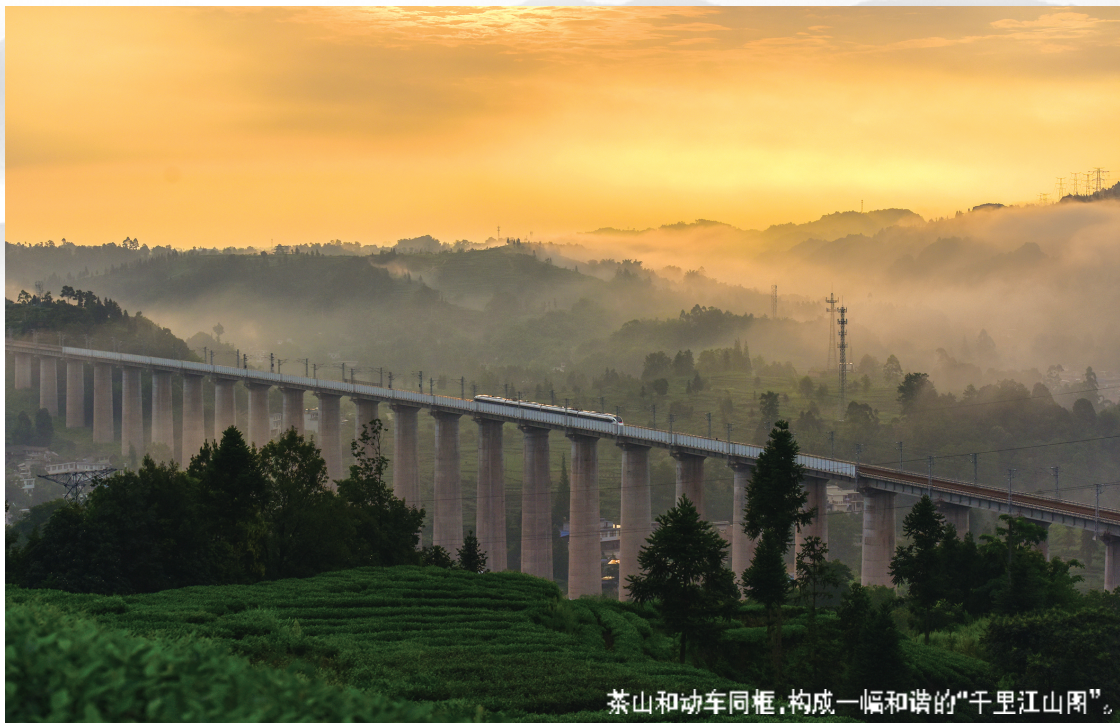
茶山和动车同框，构成一幅和谐的“千里江山图”。

水墨风的画面中，仙气缭绕，不少人以为这是AI创作，殊不知，绝美的风景是自然天成。扬子江心水，蒙山顶上茶。公元前53年，吴理真在雅安蒙顶山人工种植7株茶树，确立了雅安作为世界茶文化发源地的地位。茶园在云蒸雾绕中若隐若现，这不仅是“千里江山图”的视觉来源，更是雅安茶高品质的“秘密武器”。雨城雅安常年多雨，“夜雨昼晴”的模式，让云雾中携带的水汽和微量矿物质通过叶面被直接吸收，在这种环境下长大的茶树，叶片更厚，茶多酚与氨基酸的比例更加协调，鲜爽度与香气自然出众。