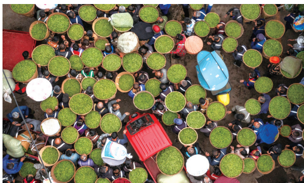
熙熙攘攘的名山茶市，茶农背篓中盛满希望。