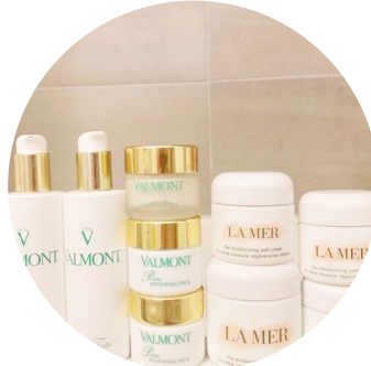
童某晒出的护肤品。