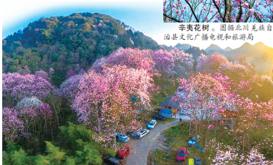
辛夷花开,吸引游人前往吴家后山游玩打卡。图据“江油发布”微信公众号