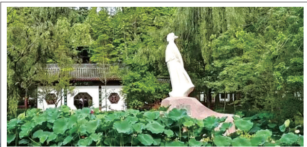
位于江油市的李白纪念馆。

很多游客慕名而来,只为亲眼见证“全国最大辛夷花基地”的震撼。吴家后山核心赏花区占地25平方公里,海拔1200米至2179米,古辛夷树垂直分布在山间腹地,现存植株超6万株,其中超过1/10为百年以上的古树,最长树龄逼近400年,历经数代守护,依旧枝繁叶茂、年年盛放。