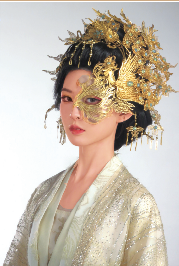
雁鸿制作的《半面妆》头饰。