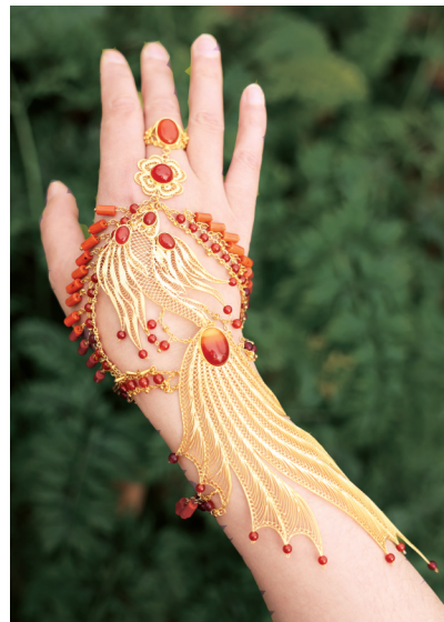
雁鸿制作的锦鲤闹春手链亮相2025年央视总台春晚《春意红包》节目。