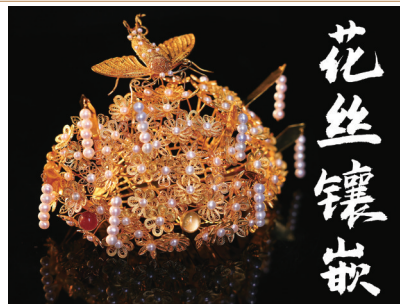
雁鸿复制的闹蛾扑花头饰。