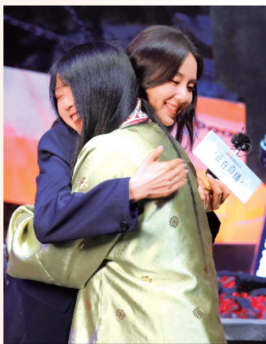
雁鸿与刘诗诗拥抱。