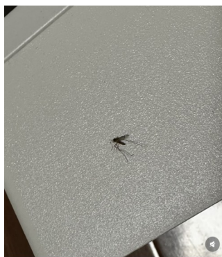
2026被我压死的第一只蚊子

昨天半夜睡着被蚊子叫醒，胳膊脖子痒了好几个大包，只能扯着被子蒙头睡，把自己憋醒发现没声一闻到天亮。刚刚拿起枕头，原来，恶毒的蚊子被我压死了#精准灭蚊