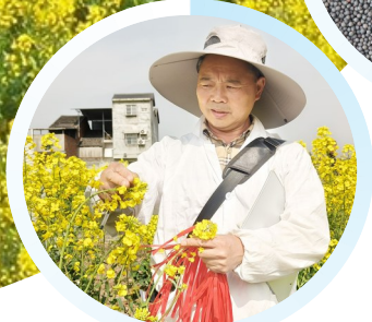
▲罗江出产的油菜籽。罗江区农业农村局供图