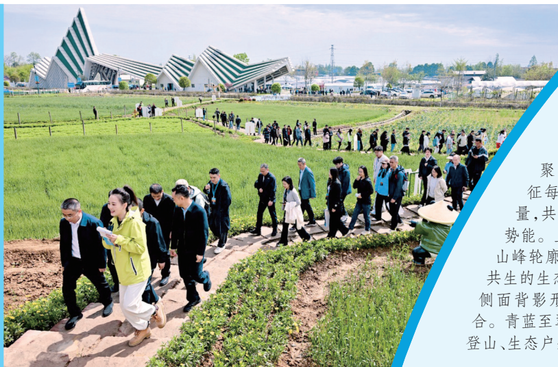
▲ 3月31日,爱好者徒步龙门之巅1号栈道宝莲山段。

当天,数千名登山爱好者与各界嘉宾齐聚什邡,共赴山河之约,让攀登精神成为蜀地鲜明的时代底色。