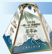
登超 | 奖牌

以“汇聚向上的力量”为主线,以极简几何线条勾勒出山峰轮廓,传递户外赛事环保健康的理念。最具巧思的是,奖牌采用可拼合的山脉形态设计——多人组队打卡不同山峰,可将各自奖牌拼合成完整的“团队攀登版图”,让集体记忆可视化;单人完成多峰挑战,亦可自由排列组合,打造专属“登山成就墙”。从单块徽章到拼合后的山脉全景,激发更多人加入“登遍四川”的行列。