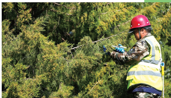
3月15日，在北京地坛公园，工作人员在修剪柏树雄株上的雄球花。