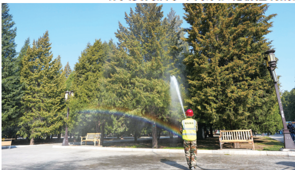
工作人员在北京地坛公园使用添加了花粉控制剂的水对柏树进行喷淋。