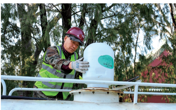
工作人员向洒水车内添加花粉控制剂。