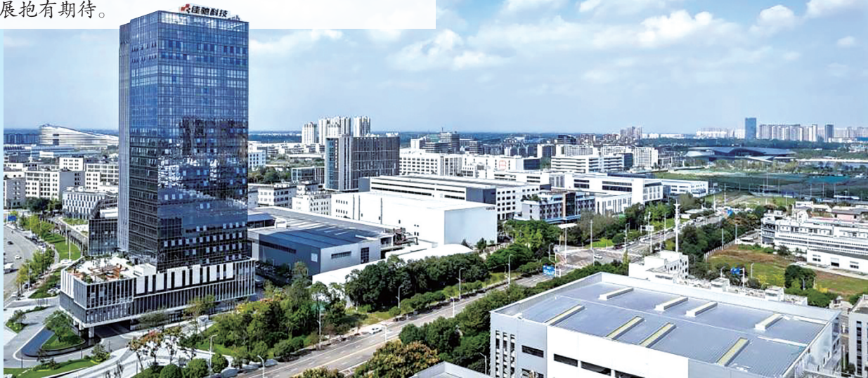
成都郫都高新技术产业园。

对成都的“偏爱”,也让四川其他地区“同苹共振”。2015年,苹果宣布在阿坝藏族自治州投资