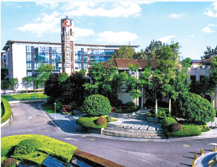
成都高新区天府长岛数字文创园。

两个光伏电站。这是苹果公司第一个在海外投资的光伏项目,也是首个在中国投资的可再生能源项目。2017年到2018年,攀钢又成为苹果中国区手机外壳模具材料指定供应商。