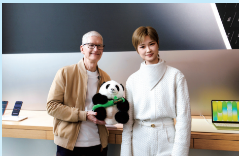
来蓉出席苹果50周年全球庆典的苹果CEO库克和李宇春合影。

3月24日,苹果公司正式宣布,2026年全球开发者大会(WWDC 2026)将于当地时间6月8日至12日举行。本次大会将聚焦软件生态升级与AI技术突破,预计将发布一系列全新AI功能。就在两天前,苹果公司首席执行官蒂姆·库克在北京也专门提到,对中国AI领域的下一步进展抱有期待。