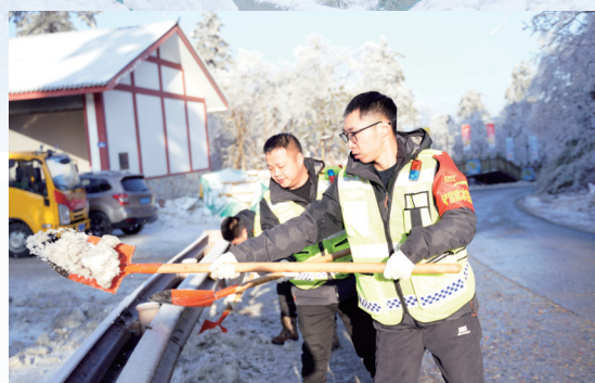
峨眉山铲雪除冰突击队队员在扫雪。

装备:6台扫雪设备。大小不同类型的除雪车任务不同,小车负责在弯道处精准铲除积雪暗冰,大车全程无差别清扫积雪。