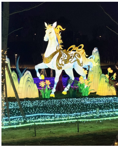
骏马灯组动感十足。

“活动期间,我们将启动无人机天幕秀,与锦云楼建筑光影秀完美融合,科技与艺术交织,极具冲击力。”成都园艺博览运营发展有限公司相关负责人介绍此次嘉年华亮点,现场有超过300名工作人员身着汉服化身NPC,上百名演艺人员倾情奉献,为市民游客营造穿越古今的沉浸式游园氛围和高水准观演体验。