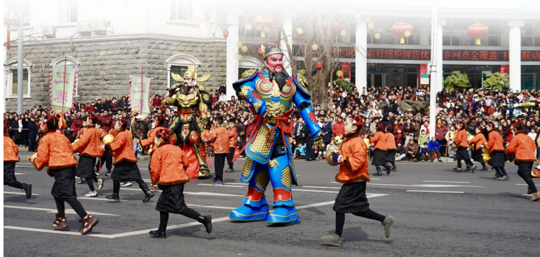
年画机甲吸引观众眼球。