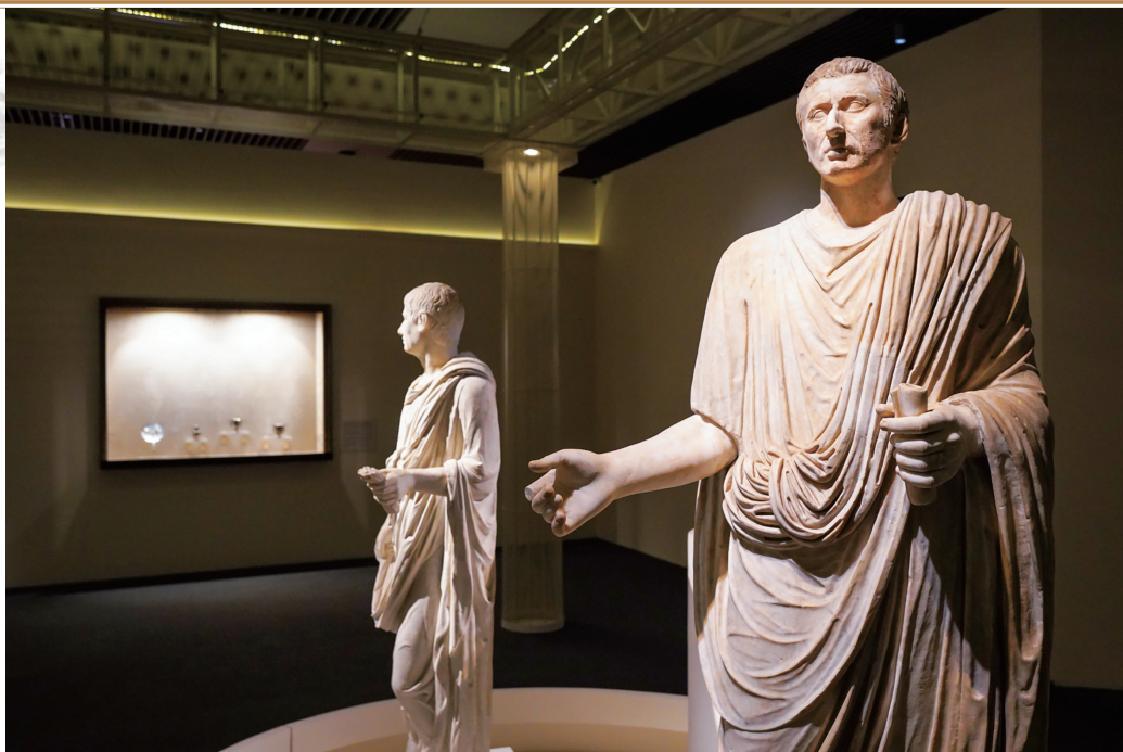
身着托加袍的市政官雕像