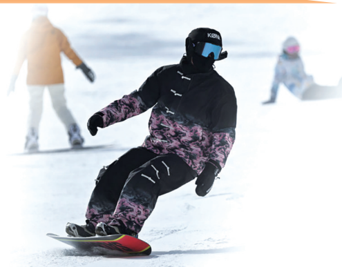
2026年1月6日,滑雪爱好者在汶川县羌人谷滑雪场滑雪。