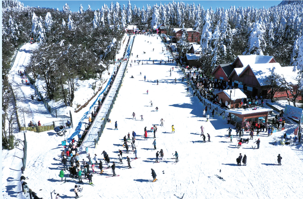
2025年1月12日拍摄的峨眉山景区滑雪场(无人机照片)。