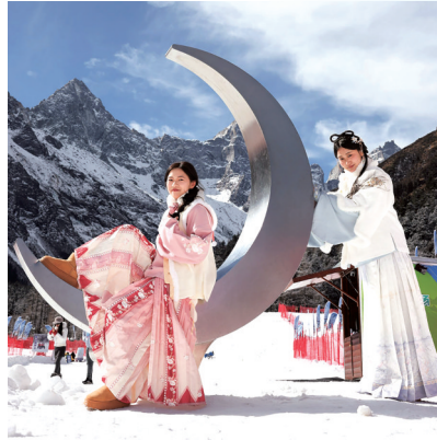
2026年1月5日,两位游客在理县毕棚沟滑雪场拍照。