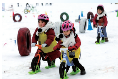
儿童在广元曾家山滑雪场。