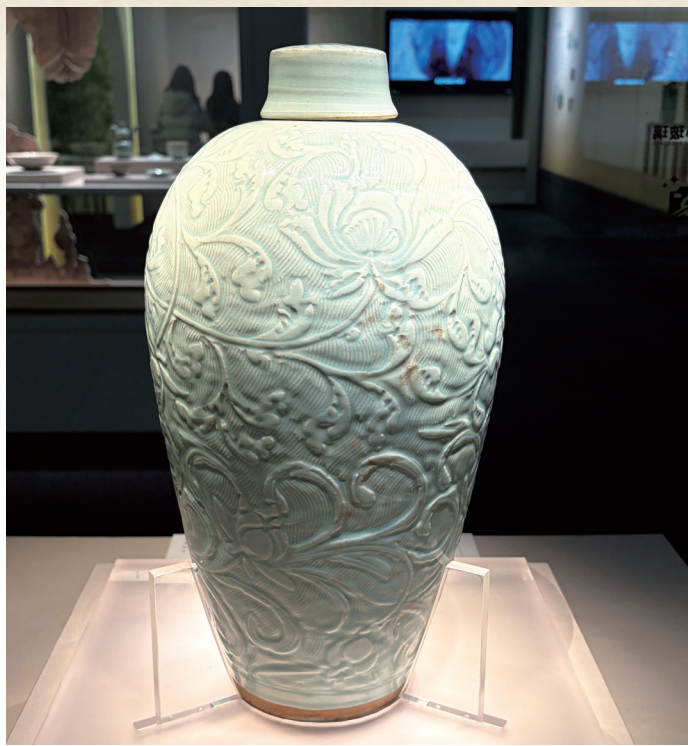
景德镇窑青白釉缠枝花卉纹带盖瓷梅瓶。

2月4日立春，一场展览让这个城市古老的故事呈现在观众眼前。当天，“东蜀都会——四川遂宁古代历史文化特展”在四川博物院亮相，展览汇集遂宁地区出土文物161件(套)，其中11件为四川博物院藏品，系统呈现遂宁从远古至明清的文明脉络，重点展示涪江流域旧石器考古新成果与宋瓷窖藏精品，彰显遂宁“遂心安宁”的历史底蕴与巴蜀文化交融特色。