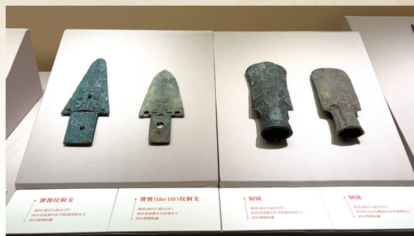
“东蜀都会——四川遂宁古代历史文化特展”展出的青铜器。