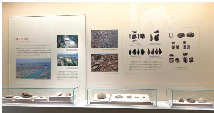
桃花河遗址石制品。