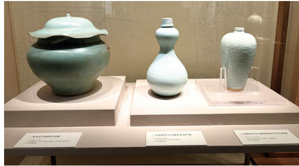
展出的遂宁金鱼村宋代窖藏文物。