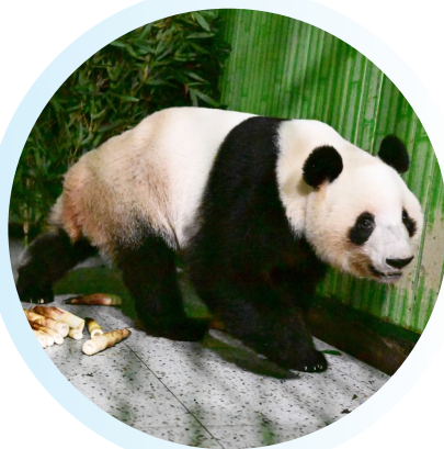
已入住雅安基地的大熊猫“蕾蕾”。

1月28日，记者从中国大熊猫保护研究中心获悉，旅日大熊猫“晓晓”“蕾蕾”已入住熊猫中心雅安基地，接受隔离检疫。