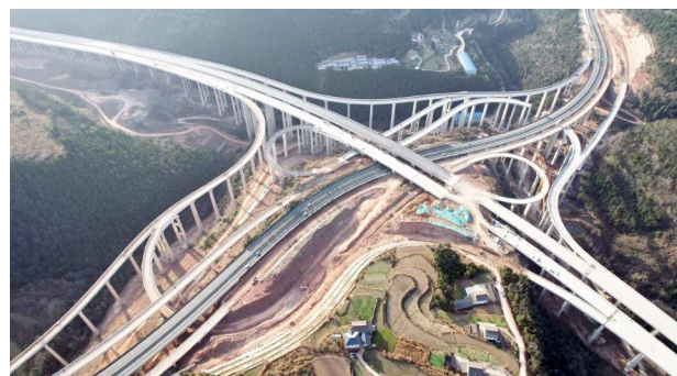
汉广绵扩容项目关键控制性工程——周家河枢纽全景。

汉广绵高速扩容项目是国家“十纵十横”综合运输大通道首都放射线G5京昆高速的关键段落，也是四川北上出川的核心通道。项目建成后，成都至汉中的行车时间将由6小时缩短至4.5小时，有效提升现有京昆高速的通行能力，增强成渝地区双城经济圈与华中华北、京津冀的交通联系。