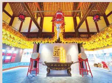
清明春台会非遗展示馆。

清明会之所以远近闻名，还因为会期较长，规模较大，场面热闹。当时，其他神会一般办一至三天，但清明会却长达七天，有时延长到十天以上。在清明会上参加物资交流的不仅有本乡、本县人，附近的商旅也闻风而来。大会不仅是娱乐的盛会，更成为商品交易大会。每逢会期，来自各地的商人们就在河坝上摆起货摊，贩卖玉器珠宝、麻油米面、各色绫罗绸缎……在那个年代，会期首日逛会的人不下5万，因此号称“川西第一大会”。