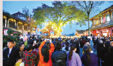
2025年，观众在元通清明春台会上观看首次点亮的“汇江老龙”。