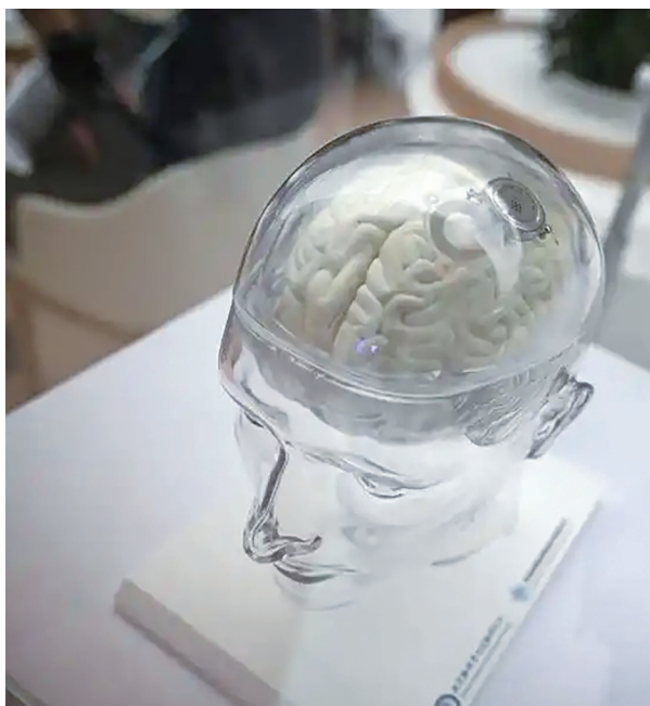
2025中关村论坛年会上展示的“北脑一号”智能脑机系统模型。