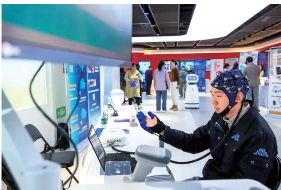
2025年10月25日，工程师在北京市朝阳区“敬老月”主题活动上演示脑机接口手部运动反馈康复训练系统。

“高位截瘫患者仅凭意念就能操控轮椅下楼遛弯、用意念操作机器狗取外卖”……这些看似科幻片中才有的场景，正在成为现实。“脑机接口”概念近日引发关注。这项前沿技术究竟是什么？当前发展态势如何？又面临着哪些挑战？