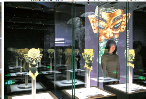
展出的青铜人头像。

两面刻有两组肩扛象牙人形纹图案的玉璋、在静态之中蕴藏着动感的石虎、展现古蜀青铜雕塑工艺技术的铜立人……此次亮相展览的金沙文物，可谓琳琅满目。面对如此类型多样的“出差”文物，文保人员又是如何“护送”文物的呢？不同类型的文物，是否会有不同的运输手段呢？