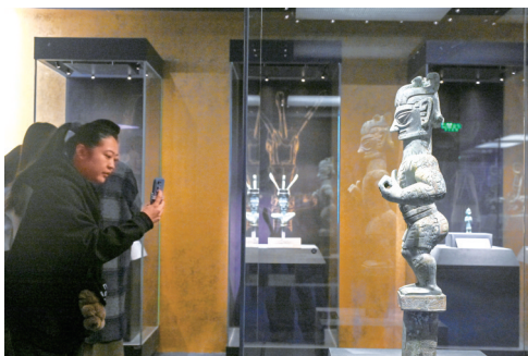
观众参观展出的青铜着裙立人像。