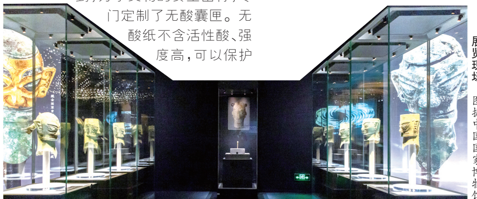
展览现场。