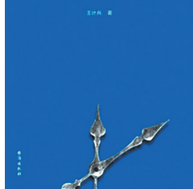
《赶时间的人》