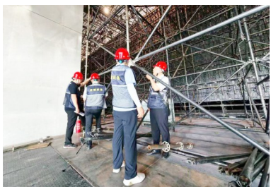
专家深入一线排查隐患。

“数据背后,是我们在专业治理、科技赋能、基层筑基、宣传聚力等关键环节,为筑牢守护人民群众生命财产安全的坚固防线的持续发力。”应急厅相关负责人掷地有声。