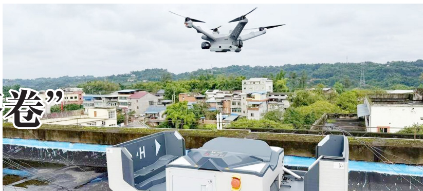
“小快轻智”新型技术装备运用到基层应急工作中。