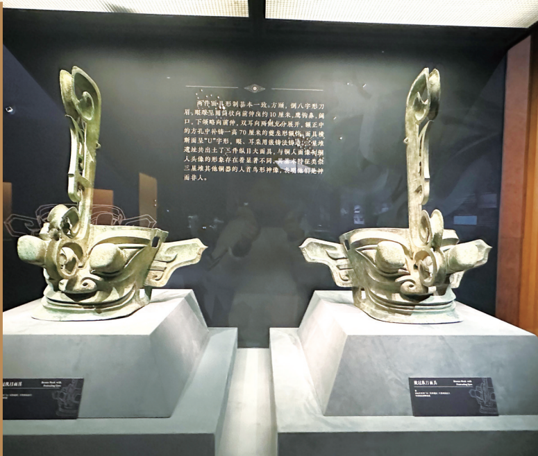
戴冠纵目面具迎来“历史性聚首”。

记者注意到,本次参展的三星堆博物馆文物不少都是“顶流”,包括自带气场的商代青铜兽面具,造型奇绝的青铜龙柱形器、太阳形青铜器,还有被网友戏称为“青铜健身教练”的青铜着裙立人像。此外,1号青铜神树、大立人像和鸟足神像也以高精度3D打印复制品形式“赴约”。这些复制件高度还原原物细节,让观众得以近距离感受三星堆文明的恢宏与诡谲。