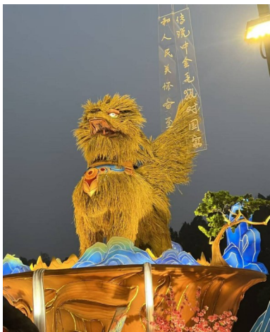
稻草制作的金毛犼。