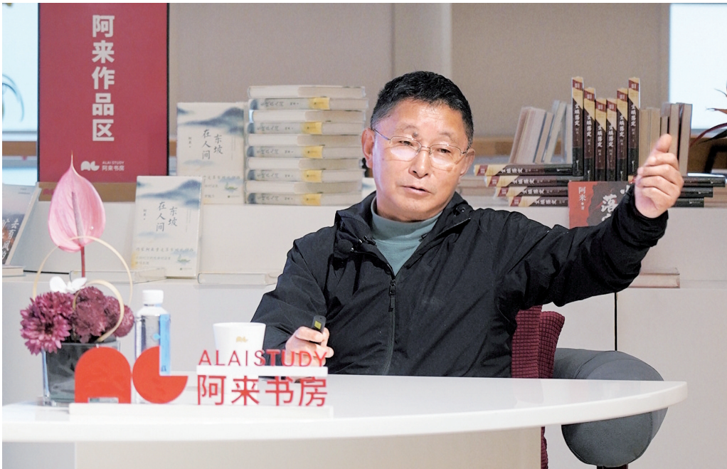
1月17日,阿来开讲“唐宋诗中的巴蜀与成都”系列讲座第十七讲。

本场讲座将核心聚焦于陆游与范成大在蜀地结下的深厚诗谊及其背后的精神世界。阿来以陆游的《春愁》与范成大的和诗《陆务观作春愁曲悲甚,作诗反之》为切入点,展开了生动对比。当一心想要领兵打仗收复失地的陆游写下“春愁茫茫塞天地,我行未到愁先至。满眼如云忽复生,寻人似疟何由避。客来劝我飞觥筹,我笑谓客君罢休。醉自醉倒愁自愁,愁与酒如风