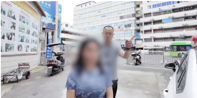
犯罪嫌疑人指认现场。