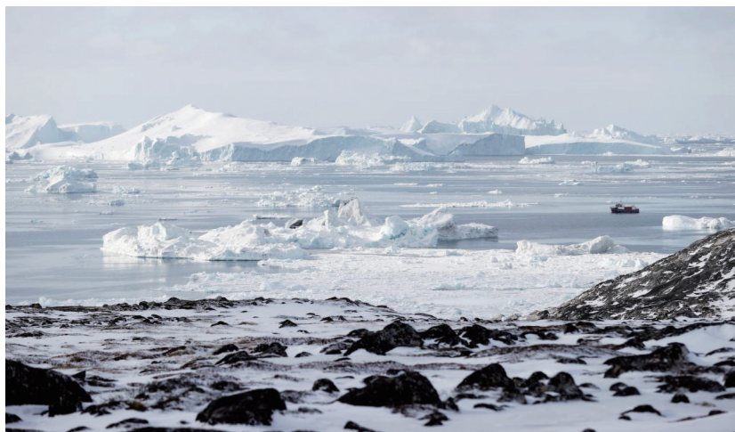
这是2025年3月22日在丹麦自治领地格陵兰岛斯科湾拍摄的冰山。

欧洲舆论认为,这些“派兵增援”的实际意义有限,更多只是显示对丹麦的支持以及对北极地区安全的重视。